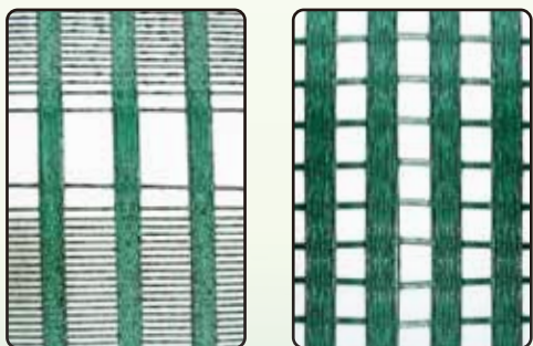
● 防火格網 ●